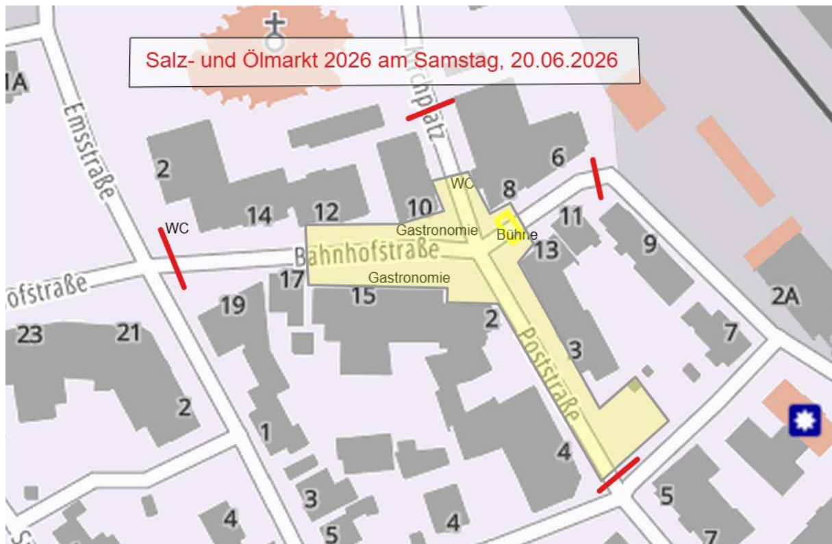
Abb. Lageplan 1 für den 20.06.2026

Die Bahnhofsstraße im Bereich von der Kreuzung Emsstraße (Brinkel) bis zur Kreuzung Poststraße (Apotheke) sowie die Poststraße im Bereich von der Kreuzung Bahnhofstraße (Cafe EX) bis zur Kreuzung Freiherr-von-Twickel-Straße sowie der Parkplatz gegenüber „Mein Imbiss“ werden in der Zeit von Samstag, 20.06.2026 von 12:00 Uhr bis Sonntag, 21.06.2026 um 22:00 Uhr gesperrt. (vgl. Lageplan 1 für den 20.06.2026)